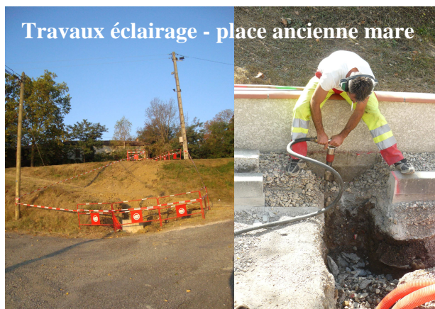
Travaux éclairage - place ancienne mare