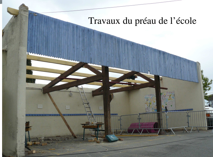
Travaux du préau de l'école