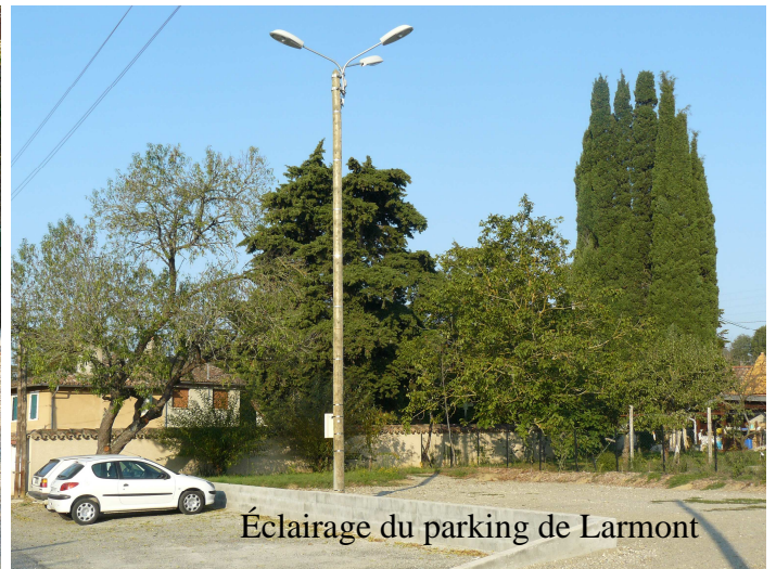
Éclairage du parking de Larmont