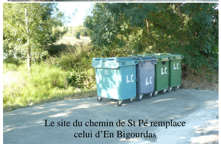
Le site du chemin de St Pé remplace celui d'En Bigourdas