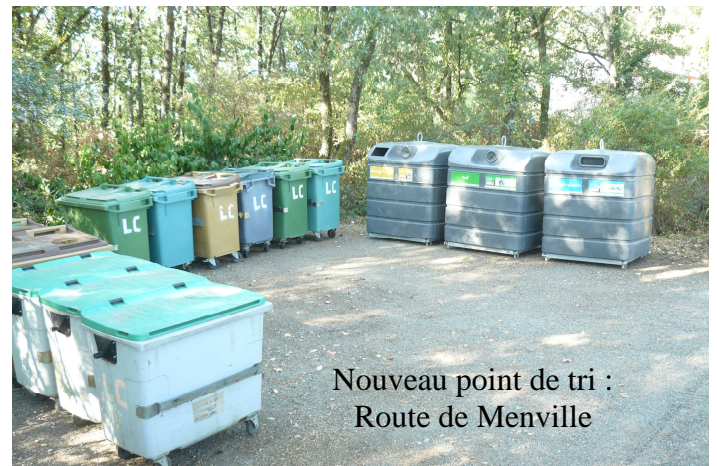
Nouveau point de tri : Route de Menville