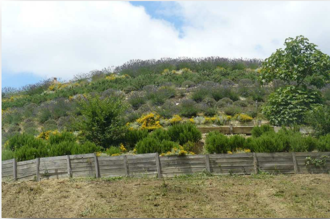
Talus - Place de la Mairie