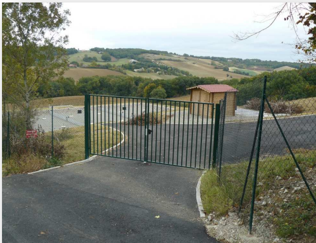
Chemin d'accès de la STEP