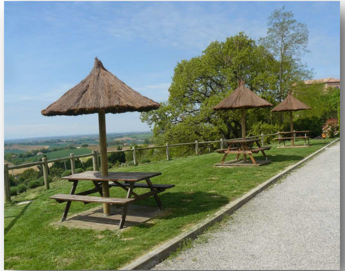
Place de la Mairie