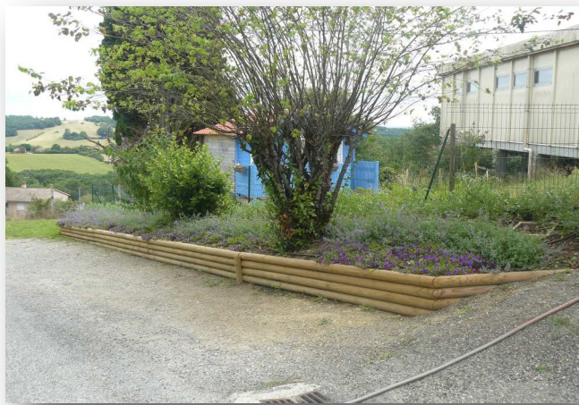
Parterre Fleurs - Ecole