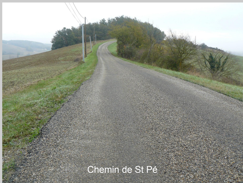
Chemin de St Pé