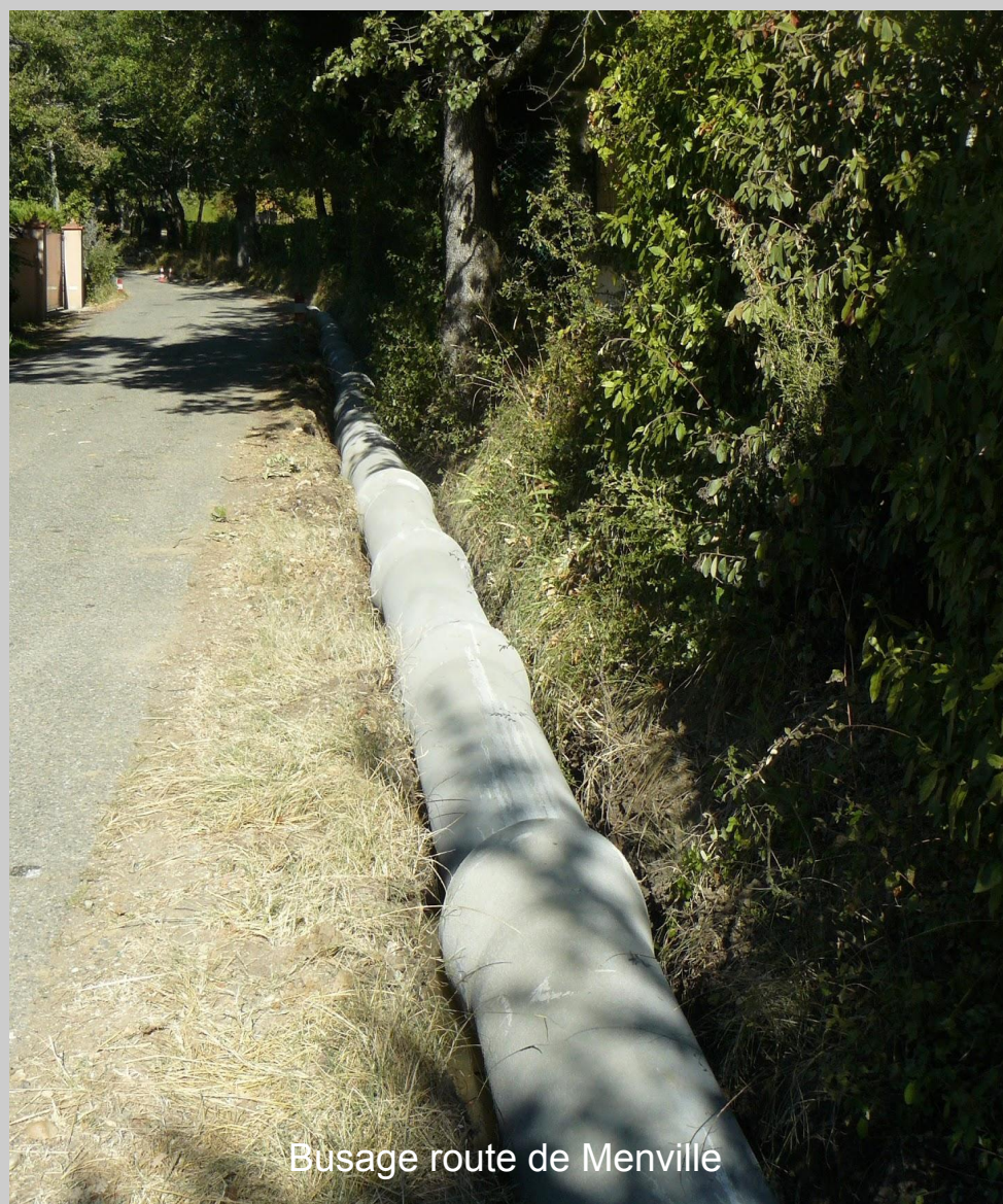
Busage route de Menville