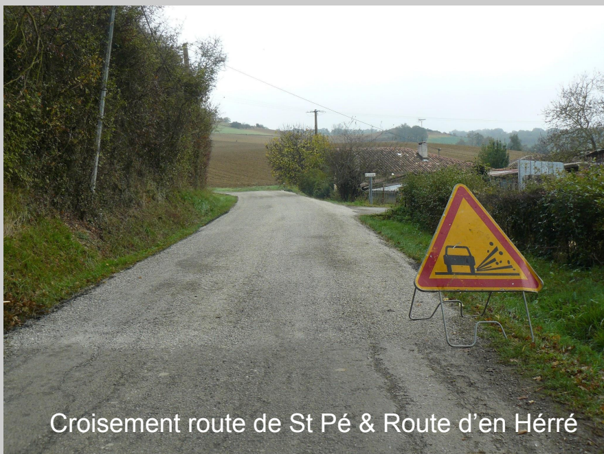
Croisement route de St Pé & Route d'en Hérré

Le Conseil Départemental subventionne notre pool routier à 58,75%, le restant étant à la charge de la Communauté des Communes. D'autre part, il a été décidé d'instituer un fonds de concours, à financer à part égale, par la commune et l'intercommunalité des Hauts Tolosans, soit un montant de 7 253€ pour la commune de Le Castéra.