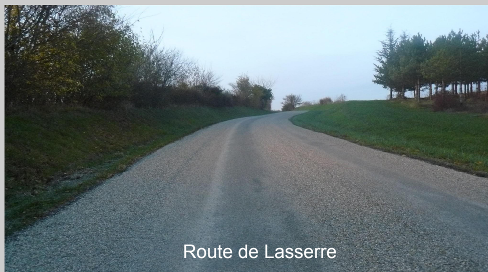
Route de Lasserre