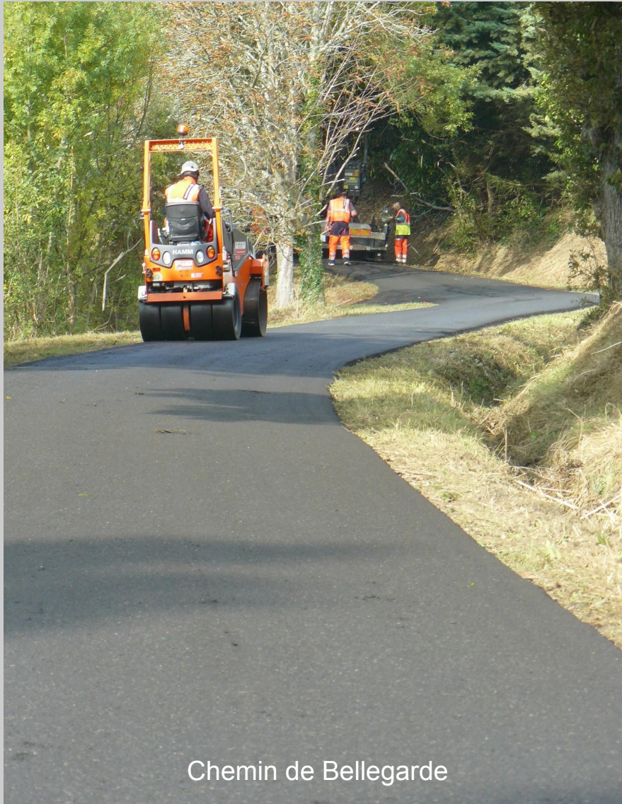
Chemin de Bellegarde