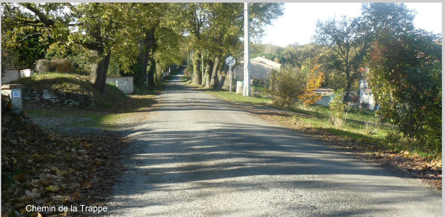
Chemin de la Trappe